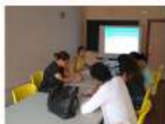
TALLER Participación democrática