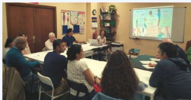
Reunión de voluntariado Septiembre 2019